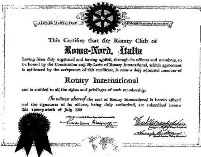
La ruota della prima riunione continentale del 15 aprile 1975