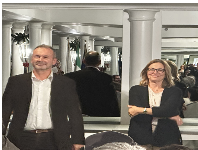
I signori Atturo